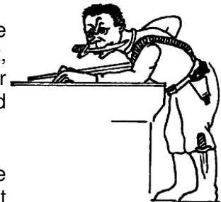
DER SPIELER MIT DEM "KILLERINSTINKT"

Tactiek speelt eveneens een rol bij het biljarten. Net zo goed als de speler erop let, dat hij na iedere stoot een goede positie overhoudt, kan hij ervoor zorgen dat de tegenstander bij een eventuele misser voor een moeilijke opgave komt te staan. Dit wordt "carotte" genoemd en wordt vaak gebruikt in de slotfase van een duel.